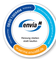
Magnet für die Heiztherme Den Magneten bringen Sie an die neu installierte Wärmeerzeugungsanlage an. Der Kunde soll im Störfall sofort die Störhotline anrufen.