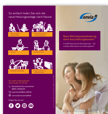
Produktflyer Wärmepumpe Der Flyer beinhaltet allgemeine Informationen für den Kunden, Erklärungen zum Produkt und welche Vorteile das Produkt bietet.