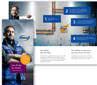
Flyer für Installateure Der Flyer beinhaltet allgemeine Informationen für Installateure zu enviaM Hauswärme.