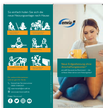
Produktflyer Brennwert Der Flyer beinhaltet allgemeine Informationen für den Kunden, Erklärungen zum Produkt und welche Vorteile das Produkt bietet.