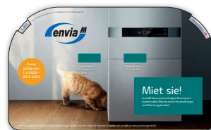
Drehscheibe Brennwert Zeigen Sie Ihrem Kunden den monatlichen Grundpreis für enviaM Hauswärme Brennwert auf Basis der Investitionskosten sowie die Kosten für die Wärmelieferung.